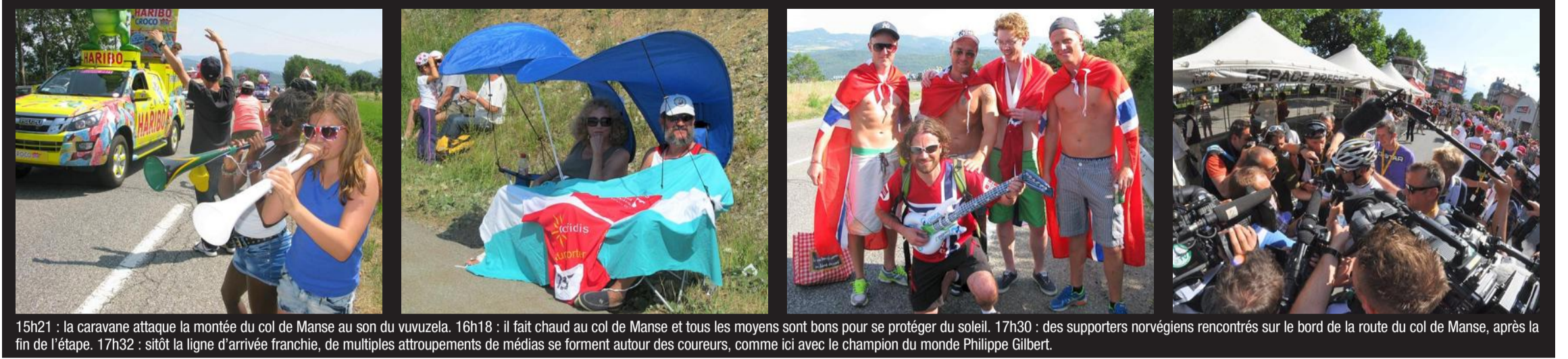
15h21 : la caravane attaque la montée du col de Manse au son du vuvuzela. 16h18 : il fait chaud au col de Manse et tous les moyens sont bons pour se protéger du soleil. 17h30 : des supporters norvégiens rencontrés sur le bord de la route du col de Manse, après la fin de l'étape. 17h32 : sitôt la ligne d'arrivée franchie, de multiples attroupements de médias se forment autour des coureurs, comme ici avec le champion du monde Philippe Gilbert.

les coulisses, les à-côtés, les photos insolites et les moments de joie de ce nouveau passage de la Grande Boucle dans les Hautes-Alpes